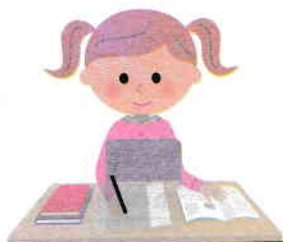
colega de bancă